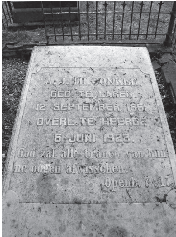
Grafsteen Aart Jonker te Heerde

graf bleek hoe Jonker heel verschillende personen om zich heen had weten te verzamelen. 235