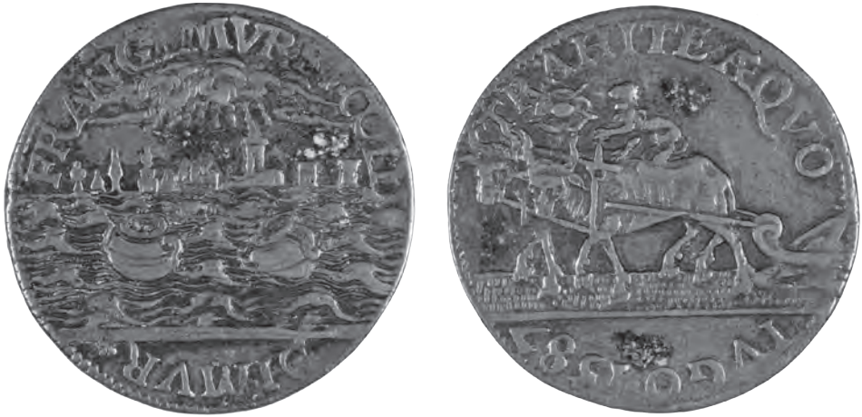
Afb. 7 Munt uit 1588, Collectie Stedelijk Museum Zutphen.

Enerzijds blijft Oomius bij zijn standpunt over Engeland, dat het zeer kwalijk heeft gehandeld ten opzichte van de Republiek en dat het een aanval heeft gepleegd op Gods volk. Anderzijds blijven de Engelsen een broedervolk. Oomius prijst de vrede, heeft er alle vertrouwen in en doet een poging om dat vertrouwen over te brengen op zijn lezers. Hier wordt eveneens duidelijk dat Oomius meebeweegt met de politieke realiteit en die op dit punt zelfs gaat propageren. ‘Het is goed om in vrede met je broeders te leven’ is in 1674 niet slechts een theologische uitspraak. Politiek gezien krijgt het ook inhoud. Daar komt nog bij dat de inhoud van de Vredesbazuin goed aansluit bij die van de biddagsbrief die is uitgegaan ten behoeve van de algemene dank- en bededag op 14 maart 1674. 126