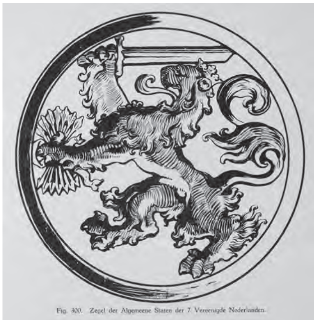
Fig. 300. Zegel der Algemeene Staten der 7 Vereeuigde Nederlanden.

met de rest verbonden worden. 47 De symboliek van de bundel pijlen speelt een rol in de Nederlandse Opstand. In 1559 sierde een leeuw met een bundel van 17 pijlen het zegel van de zeventien Verenigde Nederlanden. In 1579 is deze leeuw ook voor het zegel van de Unie van Utrecht gebruikt, alleen dan met een bundel van zeven pijlen (afb. 8). Dit symbool komt van Scilurius, die in de tweede eeuw voor Christus koning van de Scythen was. Hij maakte zijn zonen duidelijk dat eendracht sterk maakt, omdat de pijlen samen niet gebroken kunnen worden, maar alleen wel. 48 Oomius maakt dus gebruik van een bekende metafoor met een historische en politieke lading. De Unie van Utrecht waarborgt de eendracht en eendracht is tegelijk de veiligheid van de Republiek.