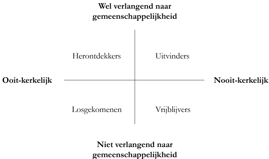
DIAGRAM 1: TYPOLOGIE (N)OOIT-KERKELIJKEN

Op basis van de twee dimensies (‘kerkelijke achtergrond’ en ‘verlangen naar het horen bij een nieuwe gemeenschap’) kunnen vier typen (n)ooit-kerkelijken worden onderscheiden. Deze vier typen worden in Diagram 1 weergegeven: