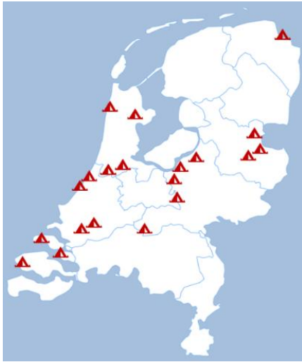
Figuur 1. Dabar in Nederland, 2021.

De campings waar Dabar aanwezig is in 2021 zijn verdeeld over het land, maar concentreren zich voornamelijk in Gelderland, Noord-Holland, Overijssel en Zuid-Holland. In Groningen en Zeeland is Dabar ook aanwezig, met name in de buurt van de kust.