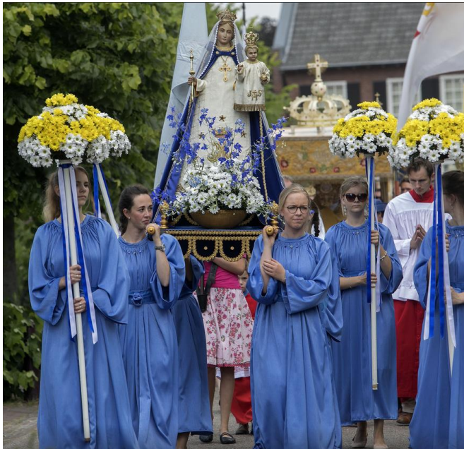
Mariaprocesie in Gerwen

In de negentiende en vroege twintigste eeuw nam de Maria-devotie nog verder toe. Dit kwam o.a. tot uiting in Mariaverschijningen in bijvoorbeeld La Salette, Lourdes, Fatima en Beauraing (Post in: Van Montfoort 1988, 26).