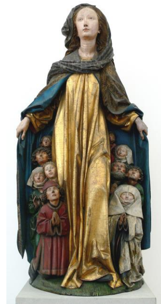
Ravenburger Schutzmantelmadonna. Vermoedelijk Michel Erhart, rond 1480.