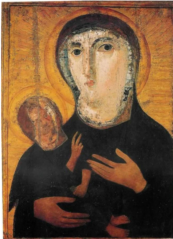
Afbeelding van Maria en Jezus in de Santa Maria Antiqua in Rome.

Een exploratief onderzoek naar de geloofsbeleving met Maria bij een aantal oudere katholieke vrouwen