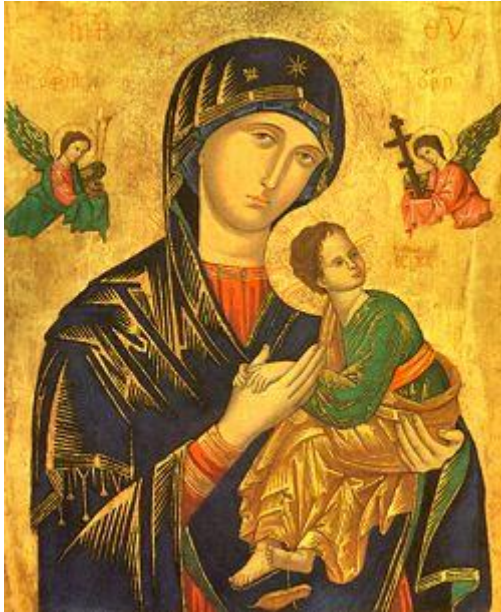
Onze Lieve Vrouw van Altijddurende bijstand

zorgen wegneemt en geborgenheid biedt. Maria is voor haar Onze-Lieve-Vrouw van Altijddurende Bijstand.